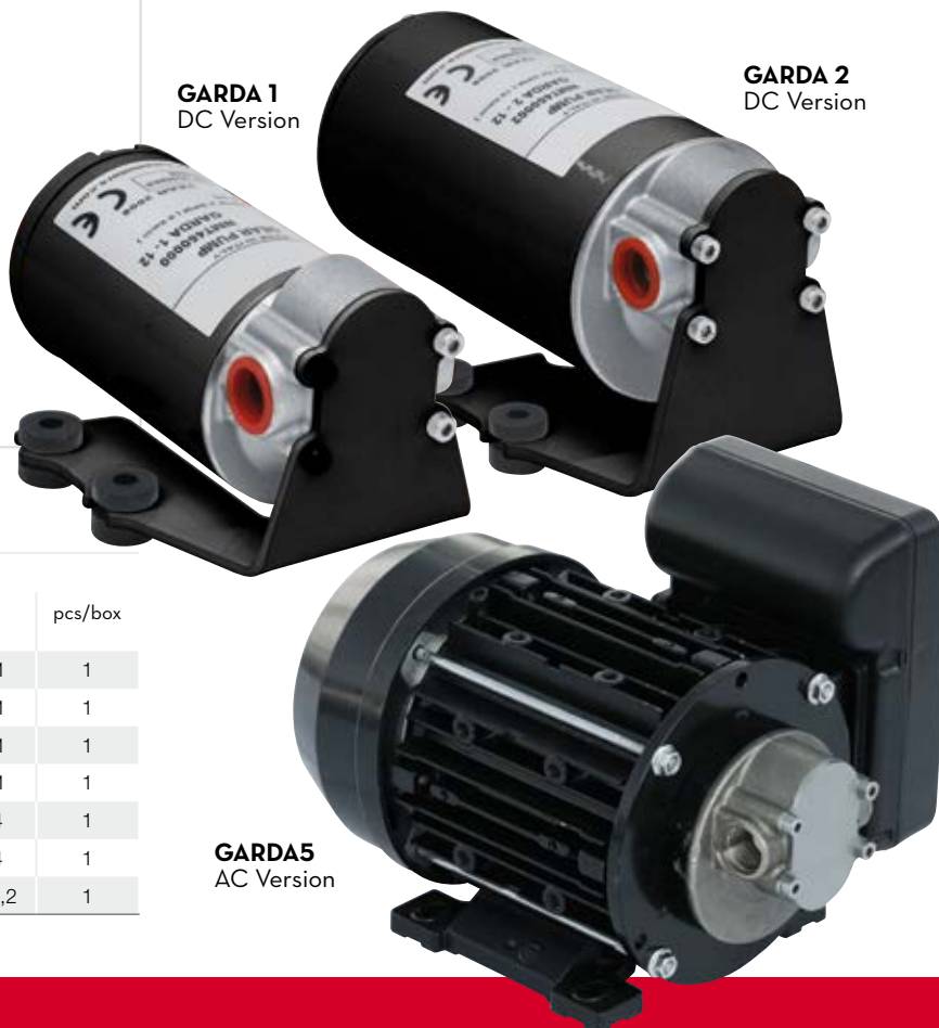
GARDA5 AC Version