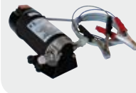
GARDA 2 with terminal, switch, cables with clamps (2 m)