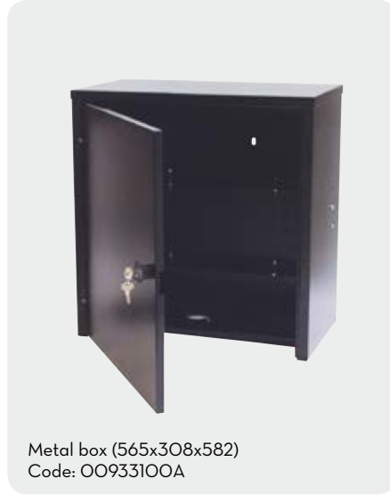
Metal box (565x308x582) Code: 00933100A