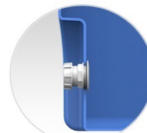
Отводы защищены от случайных повреждений