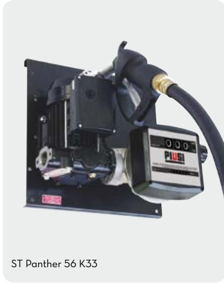
ST Panther 56 K33