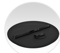
Широкая горловина + крышка с дыхательным клапаном