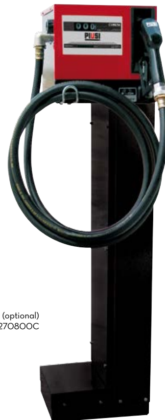
Pedestal (optional) Code F1270800C