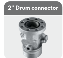
with integrated valve Code FI7163000