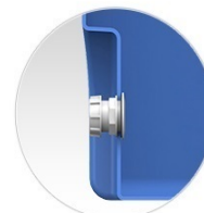
Отводы защищены от случайных повреждений