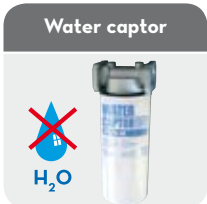
H 2 O