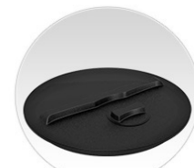
Широкая горловина + крышка с дыхательным клапаном