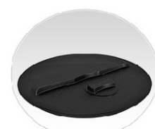
Широкая горловина + крышка с дыхательным клапаном