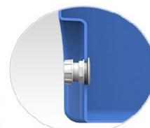
Отводы защищены от случайных повреждений