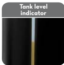
Tank level indicator