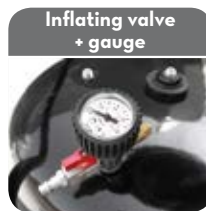
Inflating valve + gauge