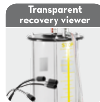
Transparent recovery viewer