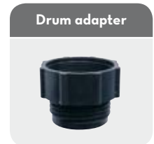
Code R1512800A F: 2" BSP - M: 70x6 Code F15236000 F: 2" BSP - M: 56x4