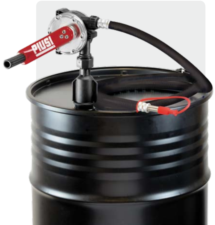
Rotative hand pump with delivery hose and stainless steel spout.