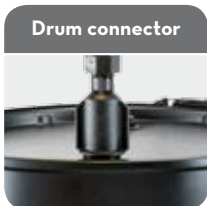
Code F19157000 Drum connector 2" BSP