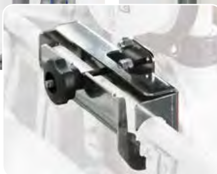
Steel support IBC brachet