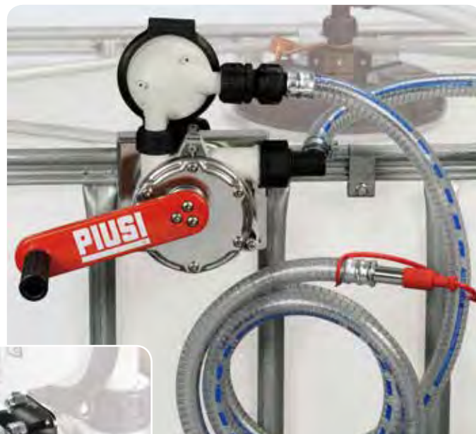
With filter version