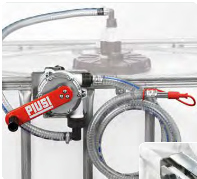
Without filter version