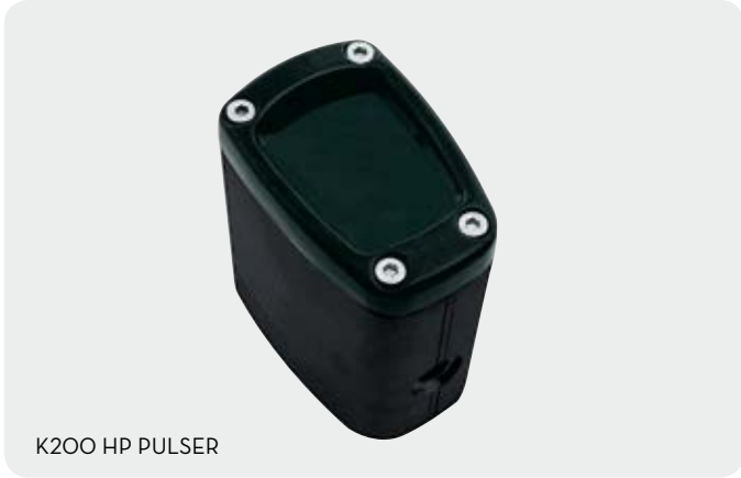
K200 HP PULSER