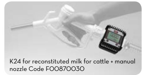
K24 for reconstituted milk for cattle + manual nozzle Code F00870030