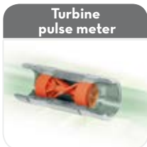
Turbine pulse meter