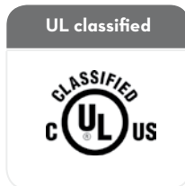
Class I Groups C and D