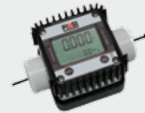
K24 ENO approved for wine and beer (on request)