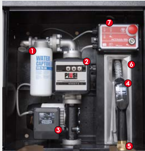
ST BOX Pro