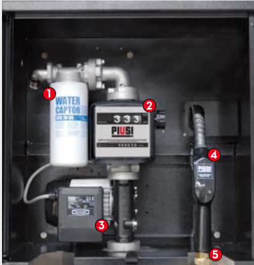
ST BOX Basic