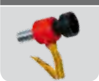
Piusi magnetic adaptor + stainless steel spout with misfilling system Code: F19174000