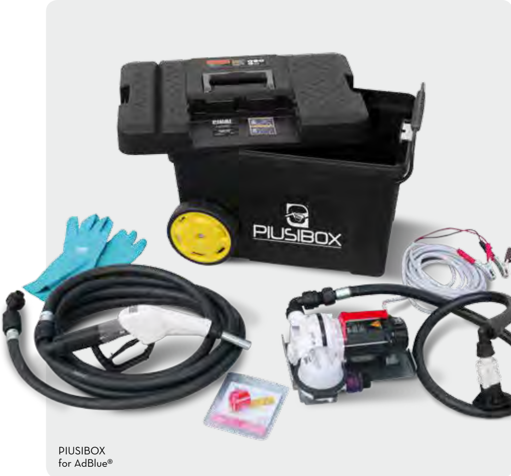
PIUSIBOX for AdBlue ®