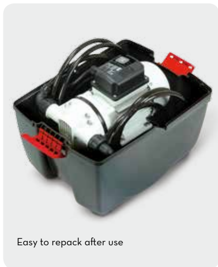
Easy to repack after use