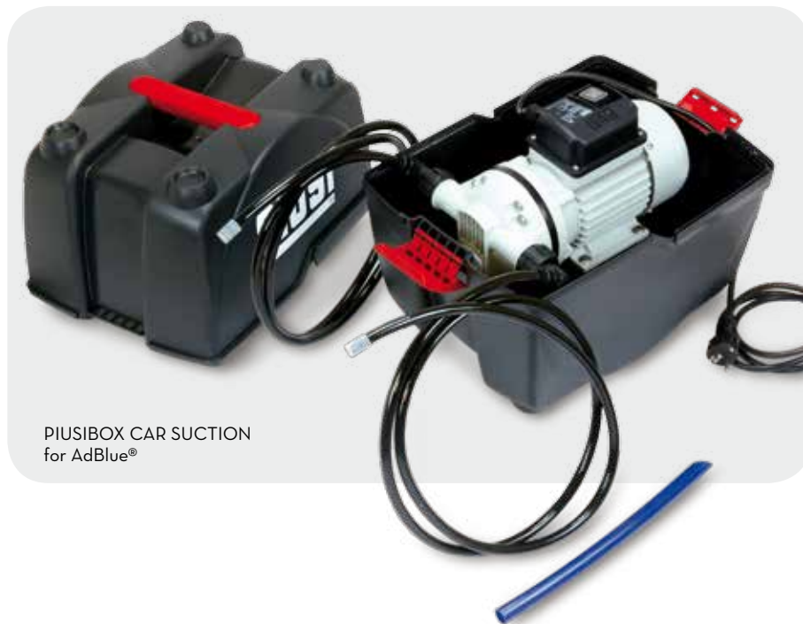
PIUSIBOX CAR SUCTION for AdBlue®